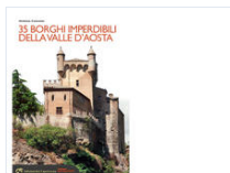
Borghi Imperdibili Della Val D'aosta