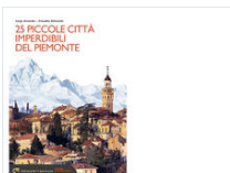
Piccole Città Imperdibili Del Piemonte